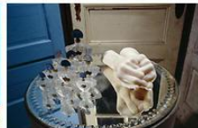
Louise Bourgeois CELL II, 1991 (detail) Painted wood, marble, steel, glass and mirror 210.8 x 152.4 x 152.4 cm Collection Carnegie Museum of Art, Pittsburgh Photo: Peter Bellamy © The Estlin Foundation VG Bild-Kunst, Bonn 2014

В этом выпуске вас ждет: актуальный календарь событий на три месяца: выставки, ярмарки, фестивали, мюзиклы, опера и классика. Рубрика наше интервью: Мануэль Шауман, организатор Streetlife Festival: изменить что-то можно только вместе достопримечательности Мюнхена, а также все музеи, театры и концертные залы. Практическая информация и транспорт, карта центра Мюнхена и