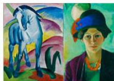
August Macke & Franz Marc

Центральной темой творчества популярной американской художницы Синди Шерман,