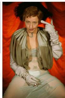
Cindy Sherman Untitled #290, 1994, Farotografie 122 x 81 cm Courtesy of the artist and Sammlung Goetz, München

В мюнхенском Доме Искусства с 30 января по 31 апреля пройдет выставка молодого, но уже довольно известного, британского художника Марка Леки, который принадлежит к одним из ведущих представителей искусства своего поколения. В 2008 году Леки был удостоен престижной премии