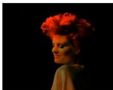
Mark Lecky Trailer for On Pleasure Bent, 2013 Video still HD video, color, sound 1:47 min Courtesy of the artist and Gavin Brown's enterprises, New York, Galerie Buchholz, Berlin/Cologne, and Cabinet Gallery, London

С 30 января по 31 мая в мюнхенском Доме Искусства состоится выставка британского архитектора ганского происхождения Дэвида Аджайе «Форма, Масса, Материал». Экспозиция постарается охватить всю разнообразную палитру работ Аджайе, которая на данный момент включает в себя около 50 завершенных проектов от роскошных магазинов и домов звезд, музеев и библиотек до