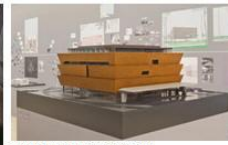
David Adjaye: Form Gewicht. Material Installationskonzept, Haus der Kunst, 2015

Творчество американской художницы и скульптора французского происхождения Луизы Буржуа охватывает более 70 лет, представляя собой богатое наследие, в котором нашли свое отражение все центральные